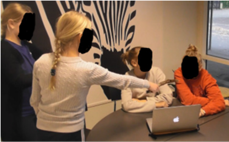
Billede 2. Interviewet.